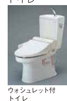
ウォシュレット付トイレ