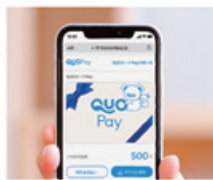
STEP 2 URLを開いて表示