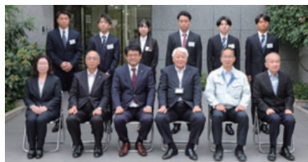
2026年度入社予定の内定者6名