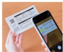
STEP 1 二次元コードをスキャン

株主総会決議ご通知に同封して発送するご案内状に印刷されている二次元コードをスマートフォンで読み取り、表示されるバーコードをクオ・カードPayご利用可能店舗でご提示していただくことでご利用いただけます。詳細については、2026年1月下旬に発送する予定のご案内状をご参照ください。なお、ご案内状を紛失等された場合の再発行はできませんので、ご注意くださいようお願い申し上げます。