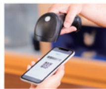
STEP 3 あとはお店で見せるだけ